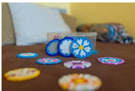
Heilscheiben & Abschirmungen