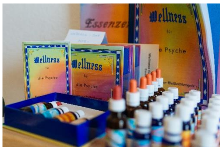
Essenzen zur Selbsttherapie