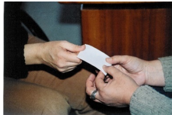
Einfach und effizient – auch zur Selbsttestung

So kann jeder mit Sicherheit feststellen, ob Nahrungsmittel, Medikamente, bestimmte Entscheidungen, ..... förderliche oder schädigende Auswirkungen auf Gesundheit oder Psyche haben.